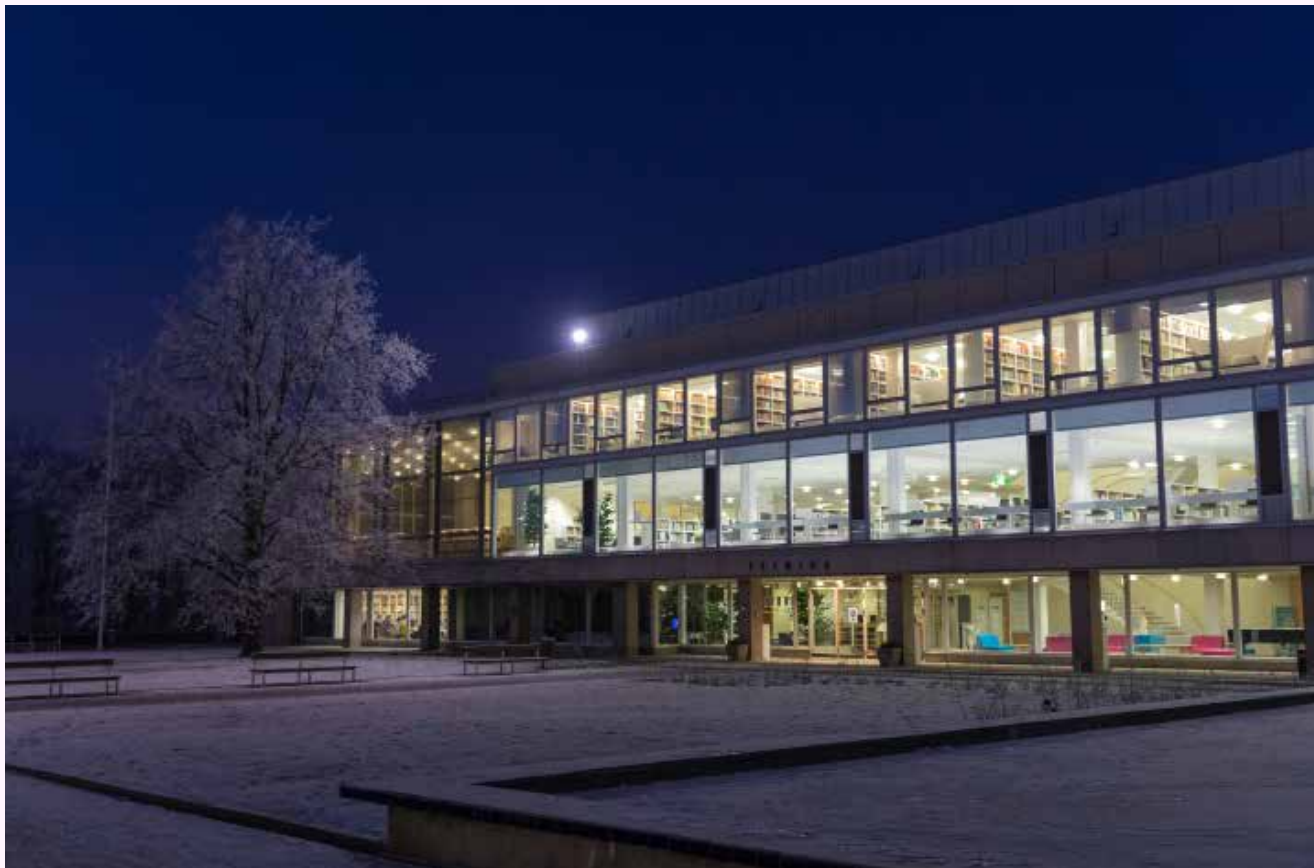
Turun yliopiston Feeniks-kirjasto Yliopistonmäellä sinisenä talviaamuna. Turun yliopiston muutosneuvottelut päättyivät helmikuun alussa.