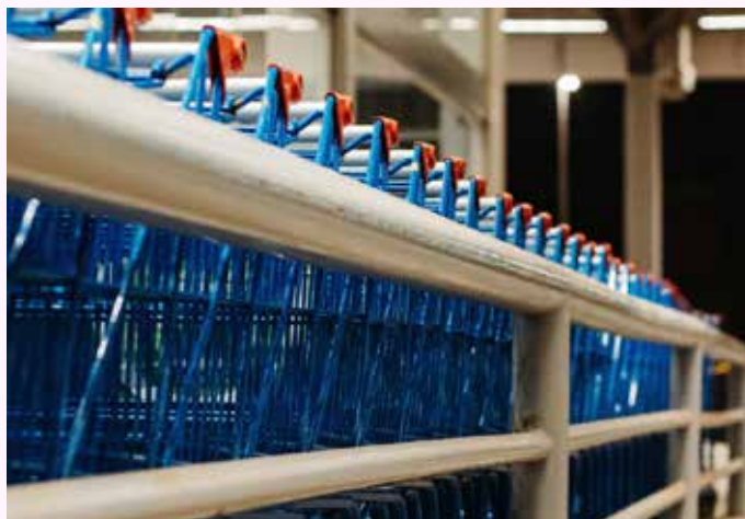
Suomen kuluttajahintojen nousu oli Tilastokeskuksen mukaan lokakuussa 8,3 %.