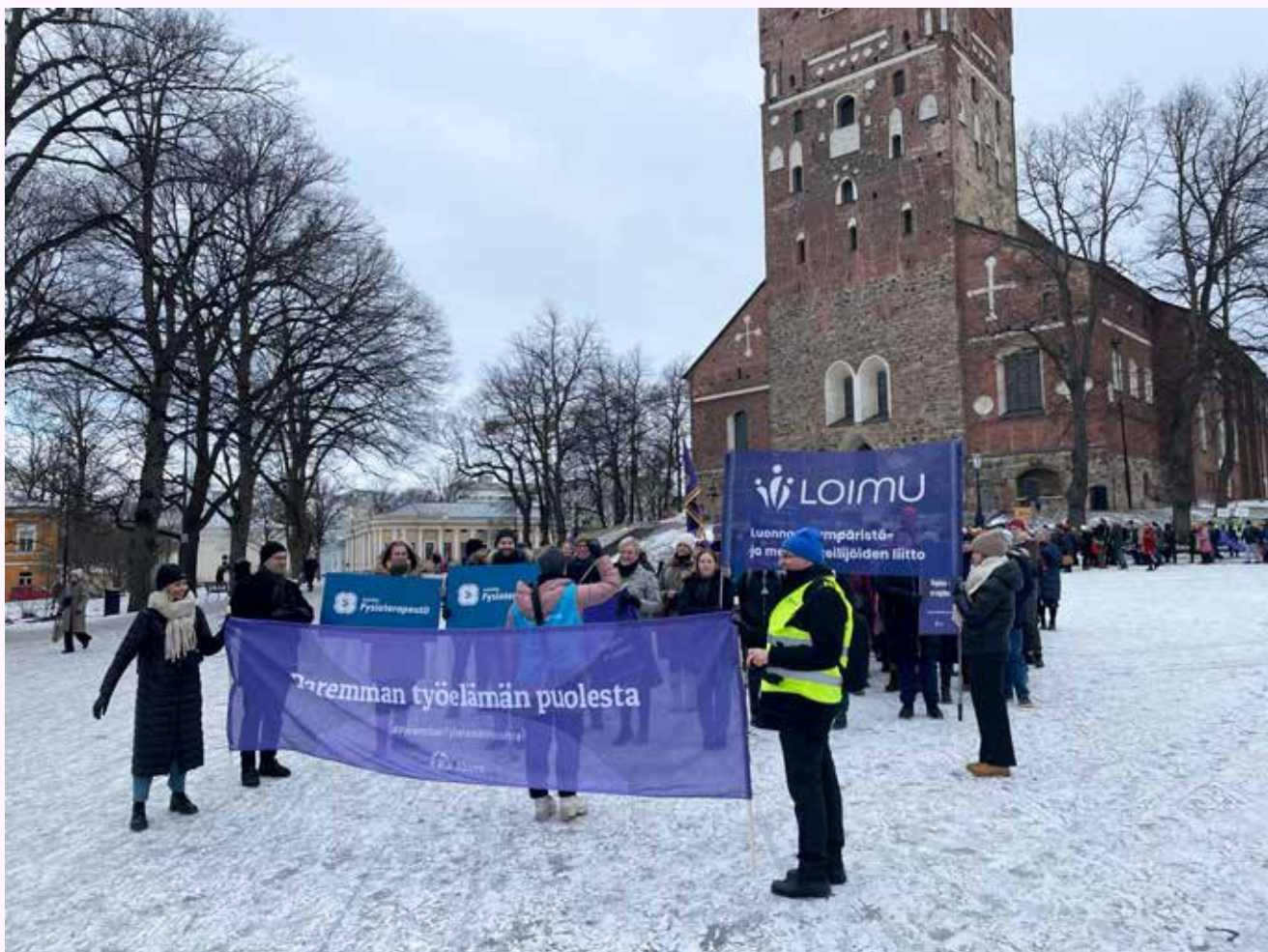
Katukuvassa ja mediassa saivat hyvin näkyvyyttä akavalaiset iskulauseet "Sopien – ei repien" ja #ParemmänTyöelämänPuolesta.

... M istä siis umpisolmun ratkaisu ja ratkaisijat? Yhtenä vaihtoehtona voisi olla palaaminen neuvottelupöytään vientivetoisen työmarkkinamallin tiimoilta. Neuvottelujärjestömme JUKO on pitänyt tätä vaihtoehtoa esillä ja sitä myös maan hallitus tuntuu kannattavan. Selvää joka tapauksessa on, että toteutuessaan tällaisen vientimallin tulisi turvata myös julkisen sektorin palkkakehitys ja palkkojen jälkeenjääneisyyden korjaaminen muun muassa naisvaltaisilla aloilla.