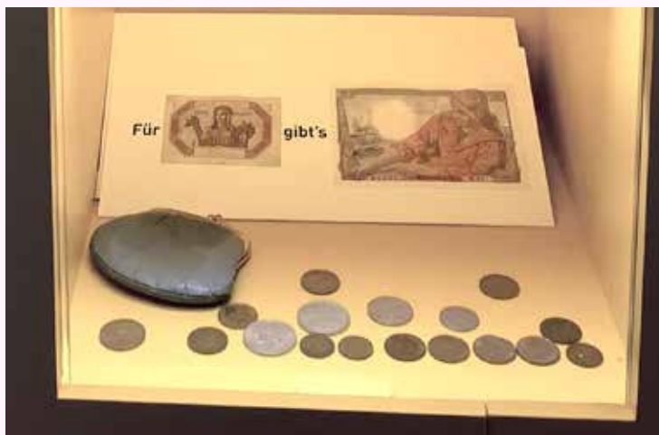
Verkostoituneissa tutkimusprojekteissa joudutaan joskus pohtimaan, minkä projektin "kukkarosta" palkat maksetaan.